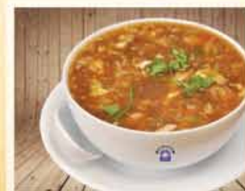
HOT N SOUR SOUP