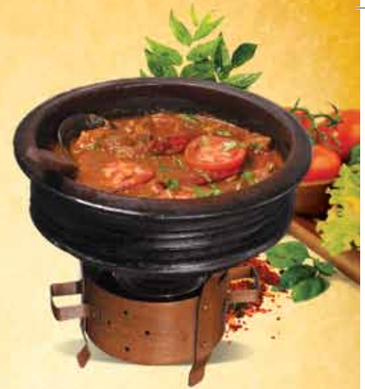
BEEF CHATTY CURRY

Chicken Chatty Curry Beef Chatty Curry Mutton Chatty Curry Ayakoora Chatty Curry Hamoor Chatty Curry Kallummakkaya Chatty Curry Nethal Chatty Curry Chemmen Chatty Curry Squid Chatty Curry Crab Chatty Curry Rabit Chatty Curry