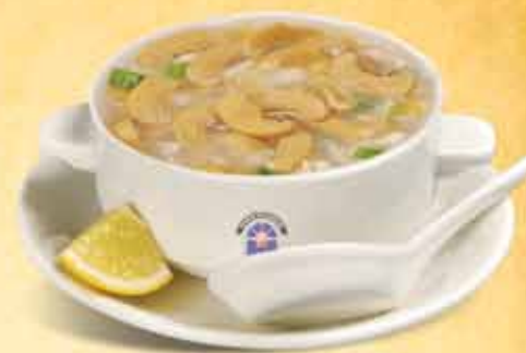
Sweet Corn Mushroom

Soup is a primarily liquid food, generally served warm (but may be cool or cold), that is made by combining ingredients such as meat and vegetables with stock, juice, water, or another liquid. Hot soups are additionally characterized by boiling solid ingredients in liquids in a pot until the flavors are extracted, forming a broth.