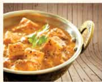
PANEER TIKKA MASALA