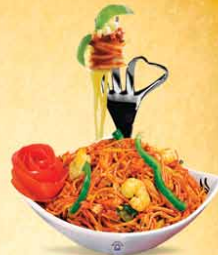
MIXED SHEZWAN NOODLES