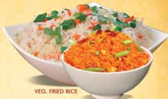
VEG. FRIED RICE