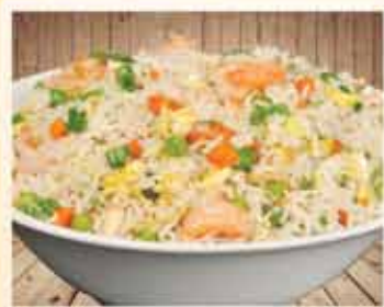
MIXED FRIED RICE