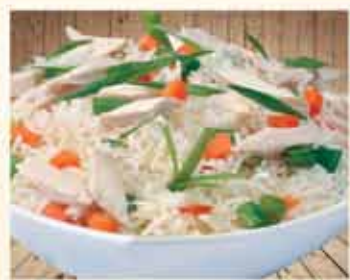
CHICKEN FRIED RICE